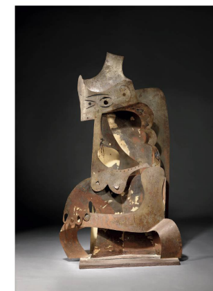
FEMME AU CHAPEAU Sculpture tôle pliée, 1961 Collection particulière