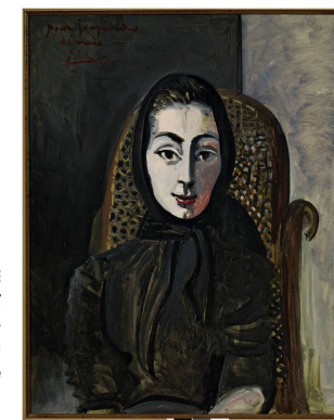
JACQUELINE ASSISE AVEC SON CHAT 1964 Huile sur toile Collection particulière

1972 Huile sur toile 145,5 x 114 cm Museum Frieder Burda, Baden-Baden