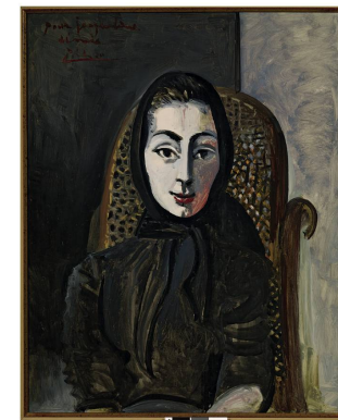
JACQUELINE ASSISE AVEC SON CHAT 1964 Huile sur toile Collection particulière

1972 Huile sur toile 145,5 x 114 cm Museum Frieder Burda, Baden-Baden