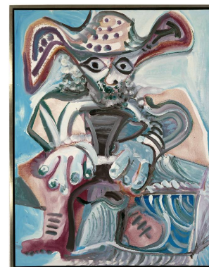
HOMME AU CHAPEAU ASSIS

1972 Huile sur toile 145,5 x 114 cm Museum Frieder Burda, Baden-Baden