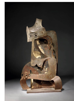
FEMME AU CHAPEAU Sculpture tôle pliée, 1961 Collection particulière