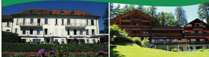
NOUVELLE ROSERAIE St-Légier (VD) 480 m CHALET FLORIMONT Gryon (VD) 1200 m

Deux Maisons de Vacances , situées dans un cadre naturel exceptionnel pour une offre de vacances personnalisée alliant confort et dynamisme.