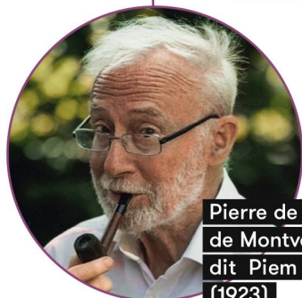
Pierre de Barrigue de Montvallon, dit Piem (1923)