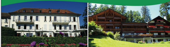
NOUVELLE ROSERAIE St-Légier (VD) 480 m CHALET FLORIMONT Gryon (VD) 1200 m

Deux Maisons de Vacances , situées dans un cadre naturel exceptionnel pour une offre de vacances personnalisée alliant confort et dynamisme.