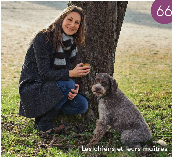
Les chiens et leurs maîtres