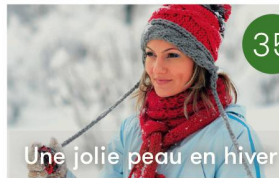
Une jolie peau en hiver