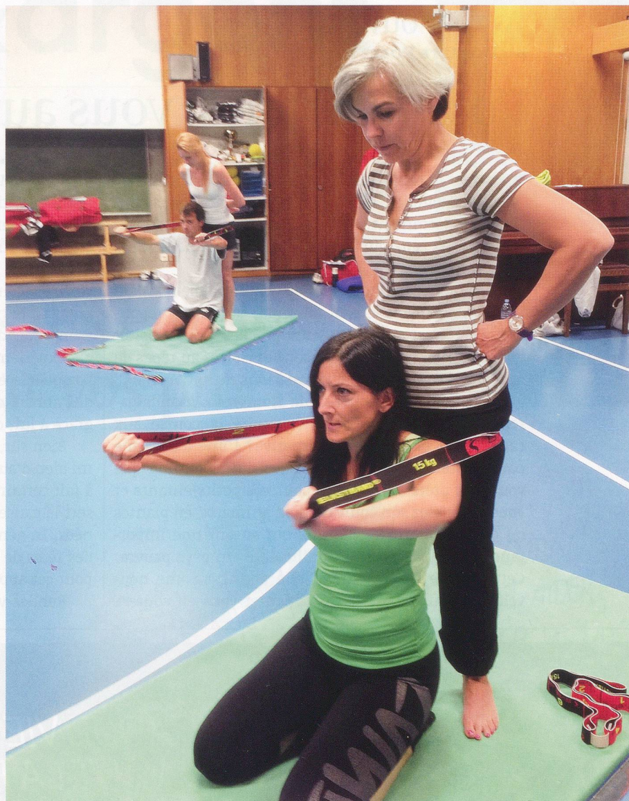
En binôme, le taïso se pratique à l'aide d'un élastique, pour des exercices de renforcement musculaire, tout en douceur.