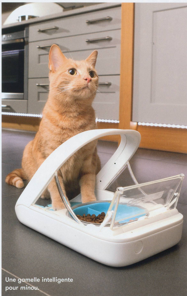
Une gamelle intelligente pour minou.