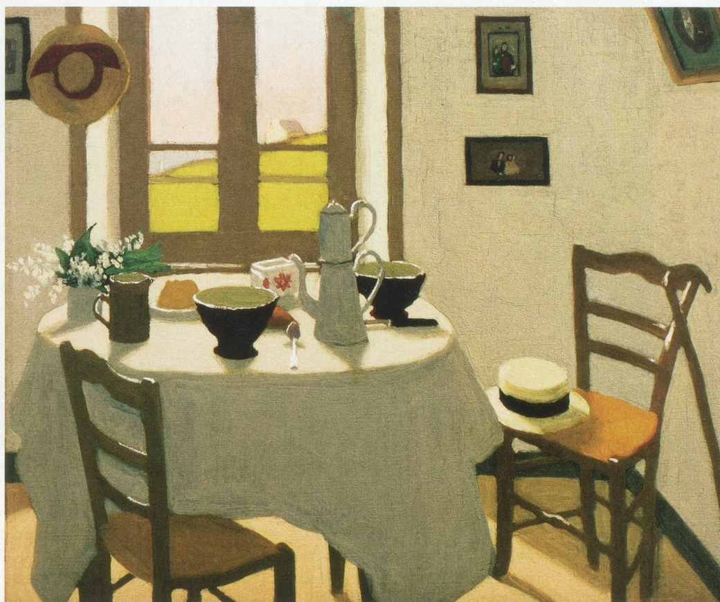
La chambre blanche, œuvre testament de Marius Borgeaud

Borgeaud parle de «l'ennuyante ville de Lausanne» qu'il