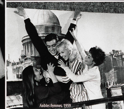
Faibles femmes, 1959

mon éducation me bloque encore, mais flute et crotte à ce que l'on attendait de moi!