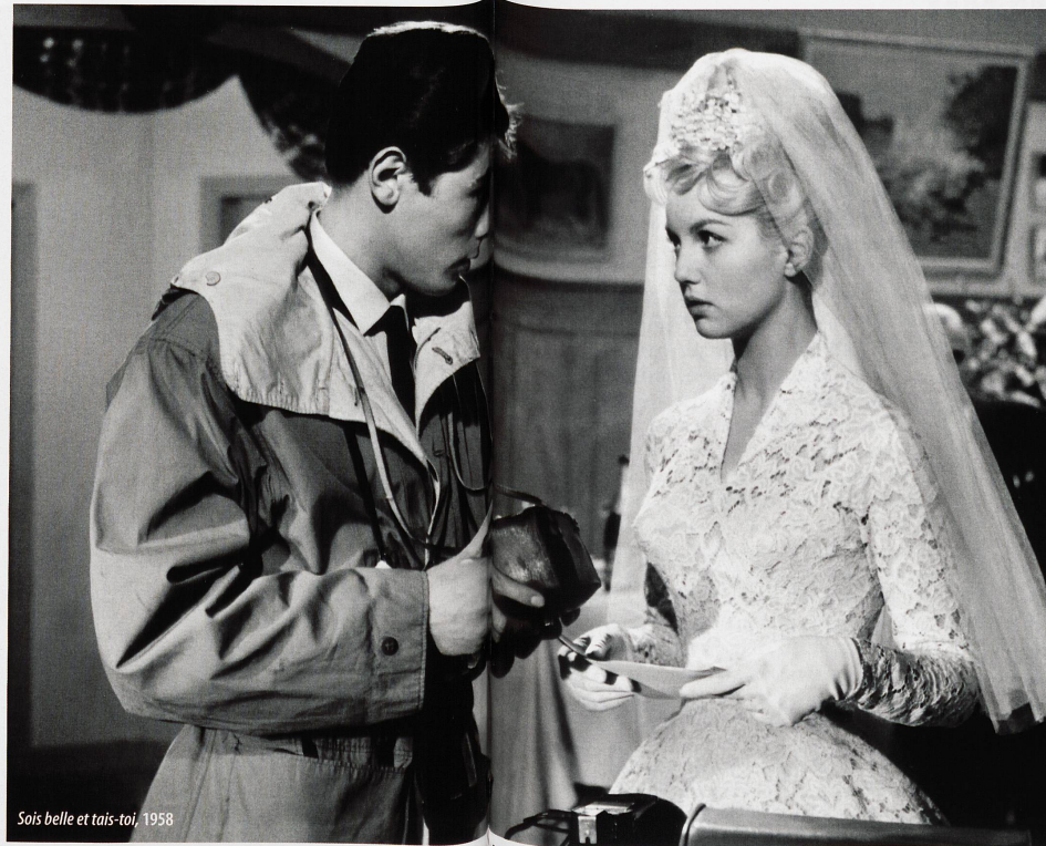
Sois belle et tais-toi, 1958