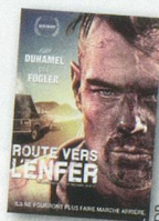
Route vers l'enfer

O n peut être les meilleurs amis du monde et finir par tenter de tuer son pote. Surtout quand on se retrouve bloqué dans le désert, en plein cagnard et sans eau. Dans ce huis clos à ciel ouvert, les tensions s'accumulent et les griefs accumulés au fil des années finissent par sortir. L'enfer, c'est les autres, disait Sartre. Preuve en est donnée une fois de plus avec ce film sorti en 2013. Après s'être fait remarquer dans la série TV Las Vegas et Transformers au cinéma, l'acteur Josh Duhamel est épataant avec sa coupe iroquois.