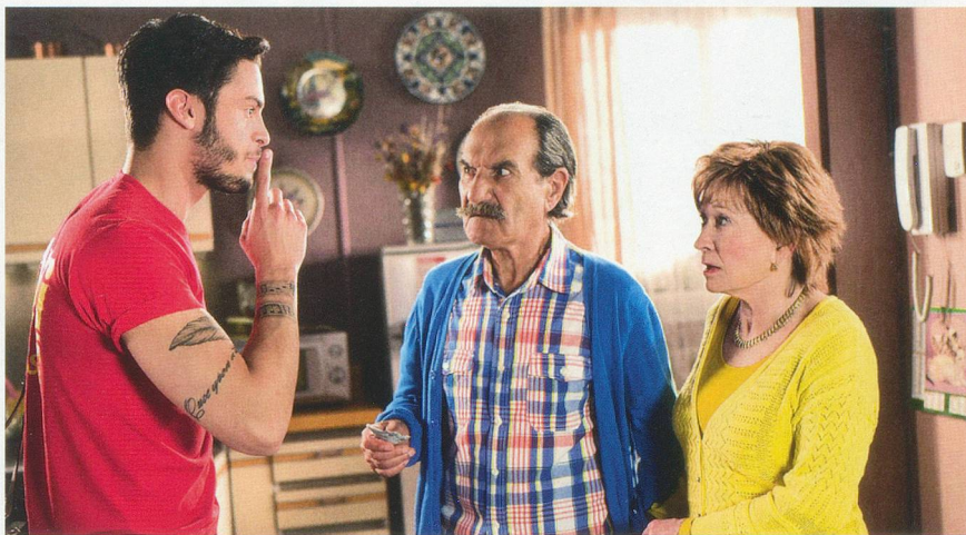
Parfois, Huguette et Raymond oublient leurs différends afin de pourrir la vie d'un tiers.

On se demande d'ailleurs comment autant de téléspectateurs peuvent s'atta-