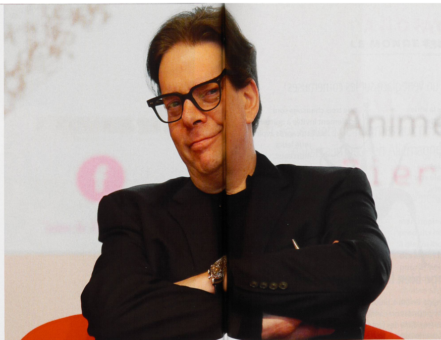
«Mes lecteurs ont beaucoup d'importance pour moi.» explique l'auteur, ici au Salon du livre de Paris en mars dernier.

Mon père irlandais et ma mère juive sont un exemple de couple raté qui a survécu. A cause ou grâce à leurs désaccords, je suis devenu rapidement