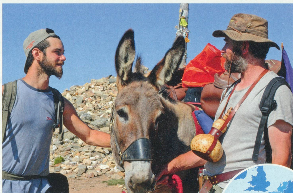
Tout au long de la route, les pèlerins font connaissance, partagent leurs expériences. Des moments forts...

Une fois les muscles chauffés et les douleurs de la veille oubliées, c'est la beauté des paysages traversés qui emplit l'âme des voyageurs. Ou alors le souvenir des siècles passés, de l'époque où les croyants devaient se battre aussi contre les loups et les brigands