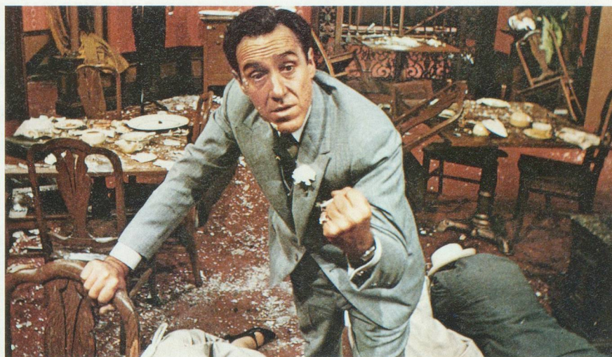
En 1929, la guerre des gangs battait son plein à Chicago. Elle trouvera son apothéose avec le massacre du 14 février.

Bref, pour en revenir au jour des amoureux, c'est bien le 14 février 1929