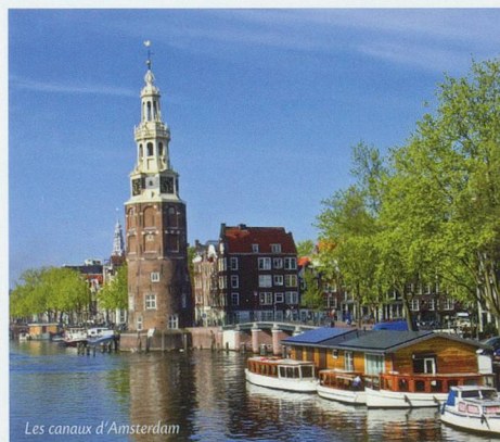
Les canaux d'Amsterdam

Petit déjeuner buffet à bord. Arrivée à Strasbourg vers 9h, puis transfert en car jusqu'en Suisse romande. Fin de nos services.