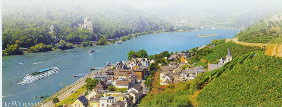
Le Rhin romantique