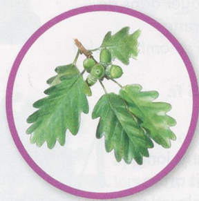
FEUILLE DE CHÊNE