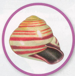
ESCARGOT DES HAIES