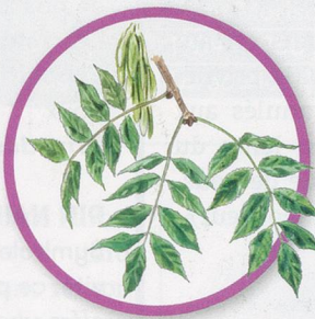
FEUILLE DE FRÊNE