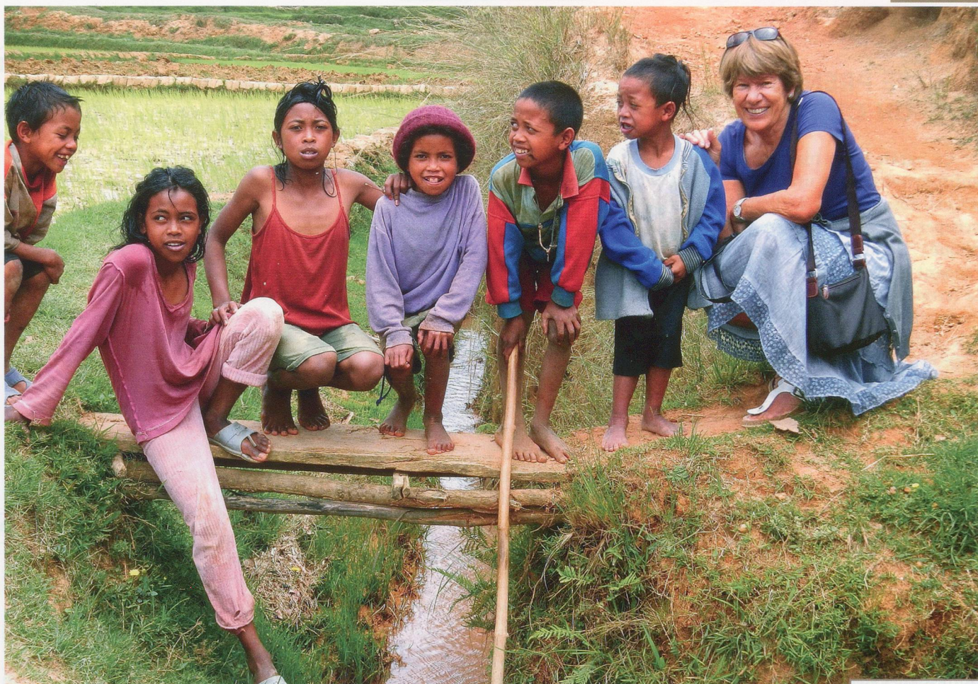
J'AIDE LES AUTRES