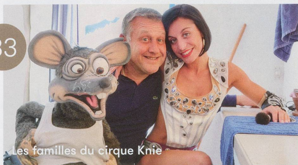
Les familles du cirque Knie