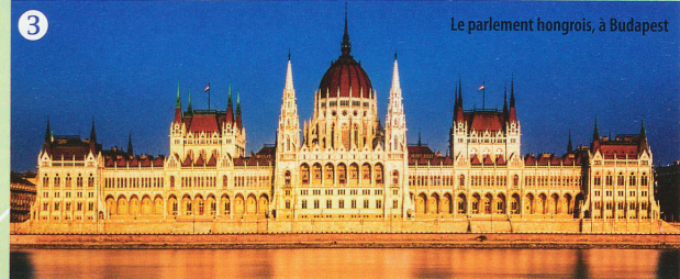
Le parlement hongrois, à Budapest