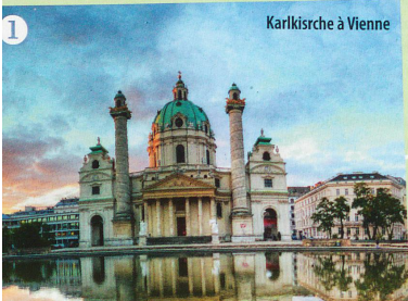
Karlskirche à Vienne