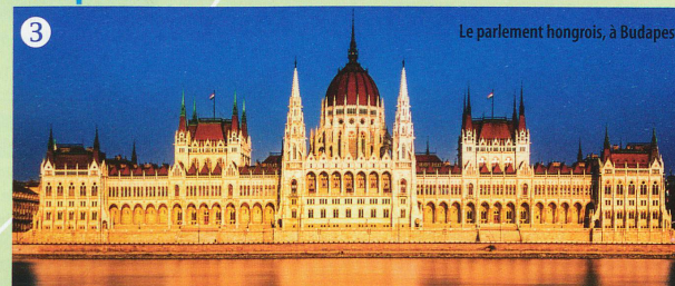
Le parlement hongrois, à Budapest