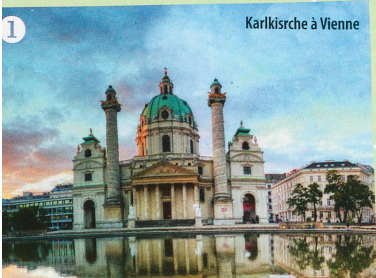
Karlskirche à Vienne