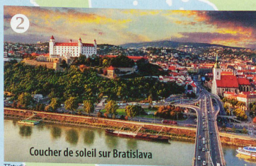
Coucher de soleil sur Bratislava

1 VIENNE la magnifique. Elle évoque le somptueux château de Schönbrunn, où vécut Sissi, une soirée d'opéra dans l'une des plus belles salles du monde, le Wiener Schnitzel, la fameuse escalope viennoise, ou la tourte Sacher, à déguster à l'ombre du pavillon de la Sécession peint par Klimt. Mais n'oublions pas son zoo, l'un des plus beaux de la planète, dont les bâtiments d'époque empruntent le jaune et l'architecture baroque au château de Schönbrunn, tout proche. Les vieilles cages au charme historique ont été conservées et accueillent aujourd'hui les visiteurs, qui, une fois à l'intérieur, peuvent observer les animaux qui se trouvent dans des enclos plus modernes! Un autre parc animalier vaut également le détour: Haus des Meeres. Dans un bâtiment de 47 m de hauteur, en pleine ville, les étages se succèdent pour nous faire découvrir essentiellement des créatures aquatiques et des reptiles. Entre requins marteaux et mambas verts, on finit par atteindre le dernier étage, qui offre une vue panoramique imprenable sur la ville.