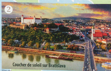
Coucher de soleil sur Bratislava

planète, dont les bâtiments d'époque empruntent le jaune et l'architecture baroque au château de Schönbrunn, tout proche. Les vieilles cages au charme historique ont été conservées et accueillent aujourd'hui les visiteurs, qui, une fois à l'intérieur, peuvent observer les animaux qui se trouvent dans des enclos plus modernes! Un autre parc animalier vaut également le détour: Haus des Meeres. Dans un bâtiment de 47 m de hauteur, en pleine ville, les étages se succèdent pour nous faire découvrir essentiellement des créatures aquatiques et des reptiles. Entre requins marteaux et mambas verts, on finit par atteindre le dernier étage, qui offre une vue panoramique imprenable sur la ville.