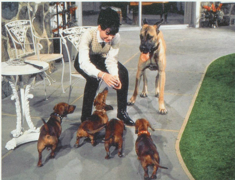
Quatre bassets pour un danois, un bon vieux Walt Disney qui fera le bonheur des petits et des grands.

Sinon, réfugiez-vous au rayon des classiques avec Les 101 dalmatiens , La belle et le clochard ou encore Chiens des neiges avec Cuba Gooding JR, dans le rôle du pauvre type vivant en Floride et qui hérite d'un attelage de chiens polaires en Alaska. Cerise sur la pâtée, un vrai classique du genre qui date de 1967: Quatre bassets pour un danois . Petit résumé: Madame s'emmourache