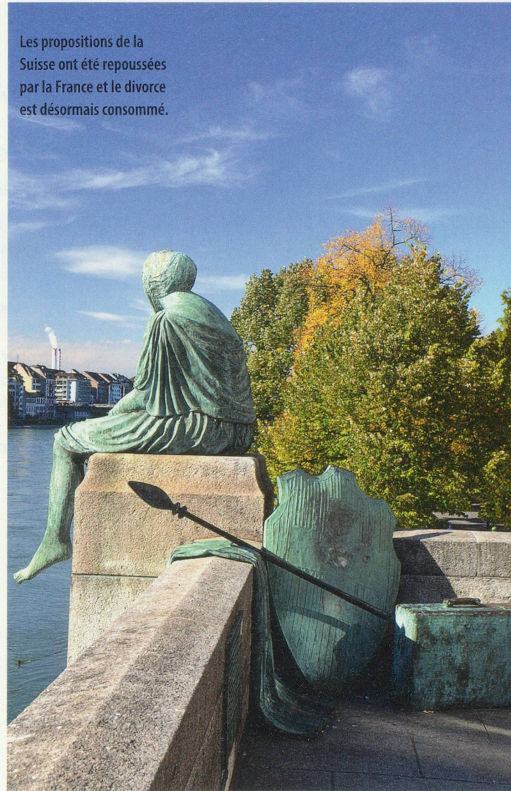
Les propositions de la Suisse ont été repoussées par la France et le divorce est désormais consommé.

On peut citer, en particulier, les personnes suivantes: l'héritier d'un défunt résidant en Suisse si cet héritier – quelle que soit sa nationalité – a été domicilié en France au moins 6 ans au cours des 10 dernières années; tout propriétaire d'un bien immobilier sis sur le territoire français; tout titulaire d'un compte bancaire en France; tout détenteur d'actifs mobiliers de source française (actions, obligations, etc.).