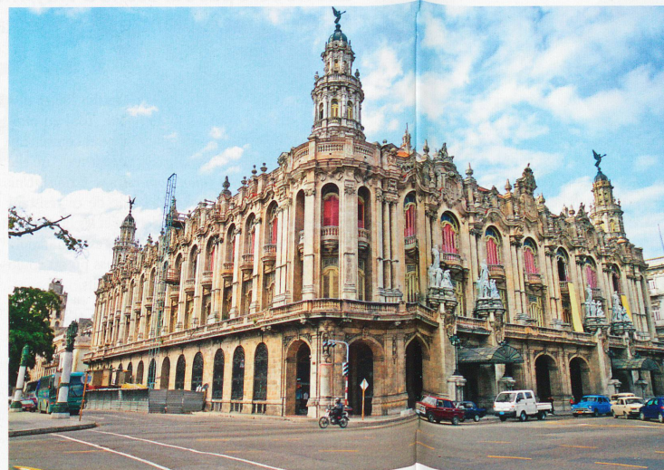
L'architecture coloniale est toujours là, les grosses voitures américaines aussi. Même si le progrès est en train de foncer sur cette île trop longtemps coupée du monde occidental.

A Guamá, plus à l'est, le décor est tout autre, puisqu'une île marécageuse trône au milieu d'une lagune. On y trouve un hôtel sur pilotis et un élevage de crocodiles. La nature a été généreuse avec cette île, en lui offrant des paysages aussi diversifiés qu'enchantés. Les hommes aussi ont bâti des trésors architecturaux. Comment ne pas tomber amoureux des rues étroites et pavées de Trini-