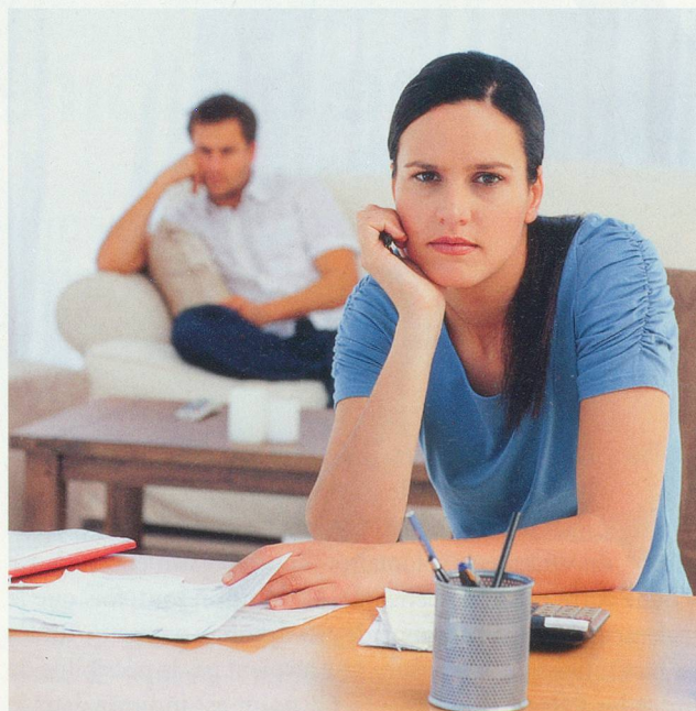
C'est souvent après un divorce et le partage du 2 e pilier que la question du rachat s'impose.

Au-delà de l'aspect de rendement, le survivant (usuellement l'épouse qui a une espérance de vie plus longue) n'a habituellement droit qu'à 60% de la rente de son conjoint décédé. Les rachats dans sa caisse peuvent ainsi servir à augmenter ses prestations de retraite.