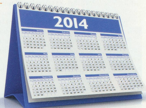
Benjamin Albiach Galan

coup de musées sont gratuits un jour par mois , alors que les cinémas font souvent des prix spéciaux certains jours de la semaine.