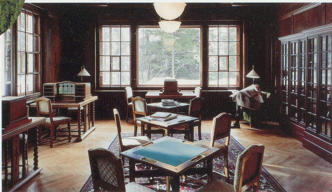
Une salle de lecture comme au siècle passé.

Après Chabrol, Olivier Assayas a aussi planté ses caméras au