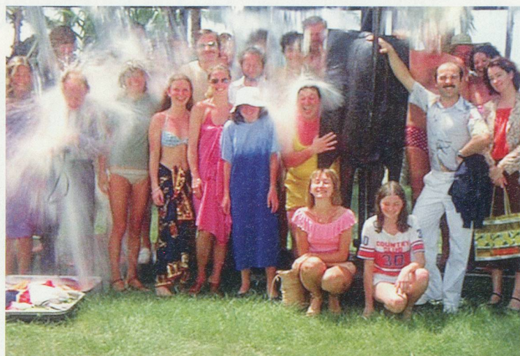
Que ce soit en Afrique ou dans les Alpes françaises, Les Bronzés a fait rire des millions de spectateurs.

DIRTY DANCING Plus joyeux, plus entraînant avec une bande-son juste incroyable et un Patrick Swayze,