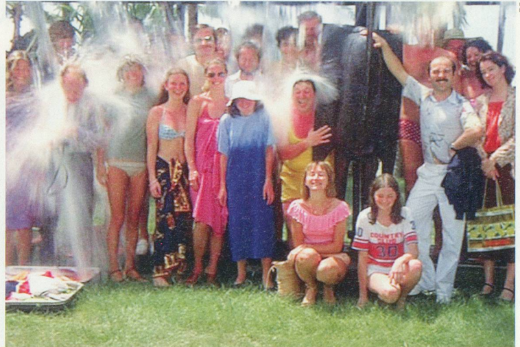
Que ce soit en Afrique ou dans les Alpes françaises, Les Bronzés a fait rire des millions de spectateurs.

DIRTY DANCING Plus joyeux, plus entraînant avec une bande-son juste incroyable et un Patrick Swayze,