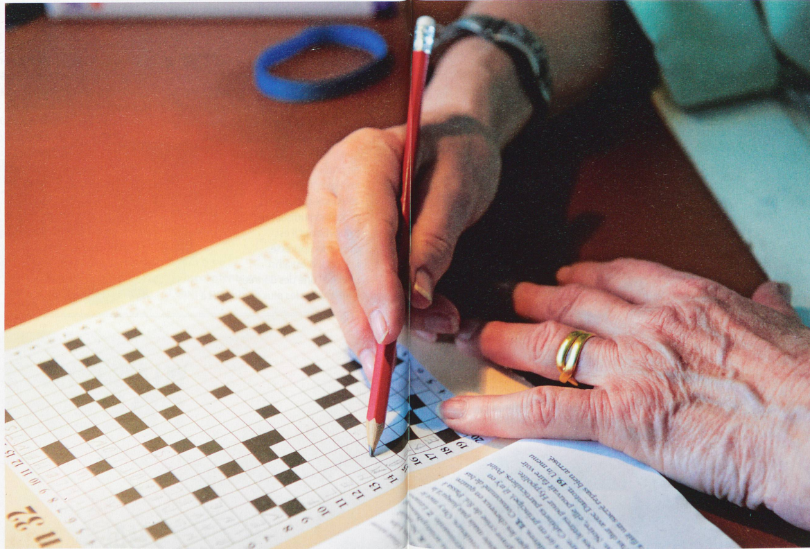
Imprimé pour la première fois en 1913, en tout cas sous sa forme actuelle, le mot croisé demande de parfois au dictionnaire. C'est à la fois un handicap – pour ceux qui privilégient l'aspect ludique – et un atout pour les joueurs qui ont soif de nouvelles connaissances.

Pour le mot croisé, tout commence il y a près d'un siècle avec l'apparition de sa forme actuelle, dissymétrique et agrémentée de cases noires. L'Anglais Arthur Wynne fait publier la première grille le 21 décembre 1913 dans le journal américain New York World . Mais ce n'est que onze ans plus tard qu'un de ses compatriotes, Morley Adams, reprend le flambeau. Une grille est imprimée outre-Manche le 2 novembre 1924, dans le Sunday Express , et la France suit une semaine plus tard, dans le Dimanche-Illustré . Depuis, un mot en neuf lettres suit la destinée du mot croisé: longévité! Le mot croisé continue en effet à s'inscrire dans la liste des jeux de réflexion incontournables, même s'il a un peu perdu de sa superbe, à en croire Régis Flament, directeur de RCI-Jeux, qui fournit en grilles la presse (française et suisse) et les éditeurs de publications spécialisées: «Aujourd'hui, les mots croisés ont clairement une connotation élitiste et senior, contrairement aux mots fléchés, plus modernes, que