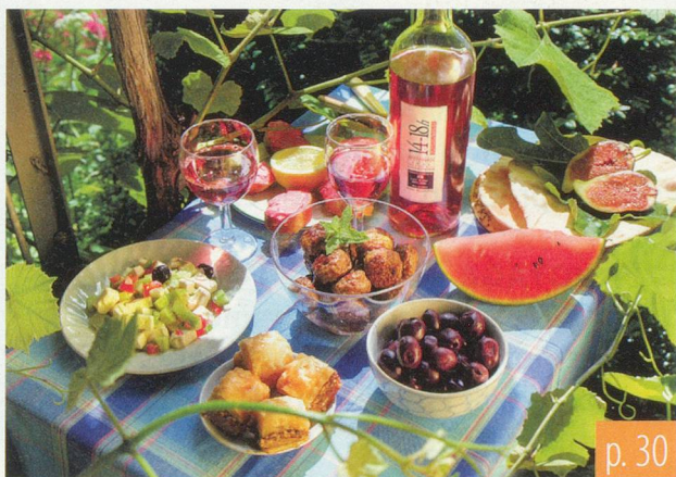
Corinne Cuendet / Wollodja Jentsch