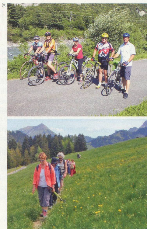
Vélo, marche ou visites, un joli panel d'activités pour ce mois de mai.

POUR LA COMMUNAUTÉ communitymanager@generations-plus.ch