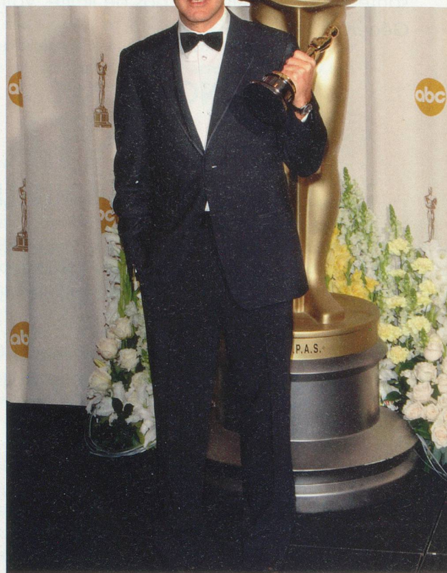
George Clooney: le talent, la séduction et aussi un grand cœur.

Remarquez, il n'y a pas de perdants parmi les nommés puisque tous repartent avec un sac contenant des cadeaux pour une valeur de 50 000 fr. Pas mal, non! Et pour vous, Mesdames, sachez que Monsieur Nespresso est non seulement beau et talentueux, mais aussi pourvu d'un grand cœur! En 2006, il avait offert son sac à une organisation de charité. Il est vraiment trop, ce George!