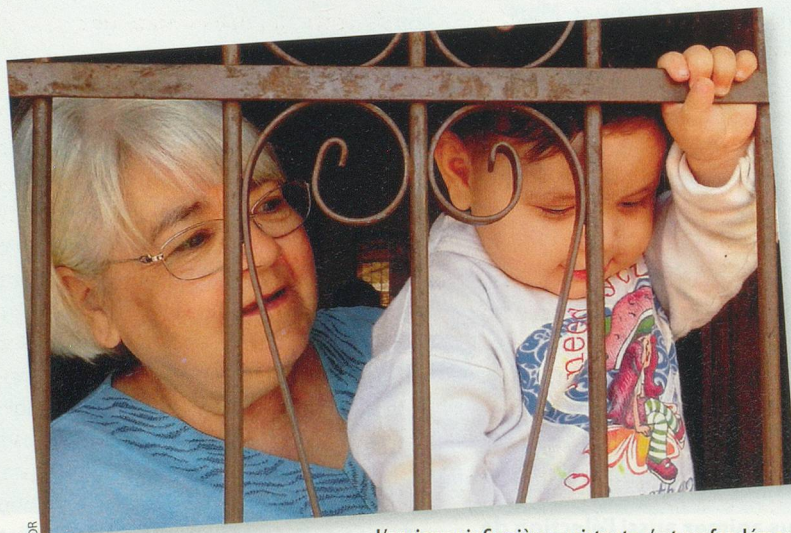
L'ancienne infirmière-assistante s'est profondément attachée aux jeunes malades rencontrés dans ce foyer.

L'annonce de son séjour au Paraguay n'a pas suscité de réactions particulières dans son entourage. «Mais à mon retour, oui, surtout de la part de mes petits-enfants. Ils ont trouvé que mon engagement était formidable! Quand j'ai expliqué les conditions de vie des orphelins, l'une de mes petites-filles, qui a 18 ans, m'a dit qu'il y avait, certes, de la misère en Suisse, mais qu'il existait des moyens d'aide, contrairement au Paraguay.»