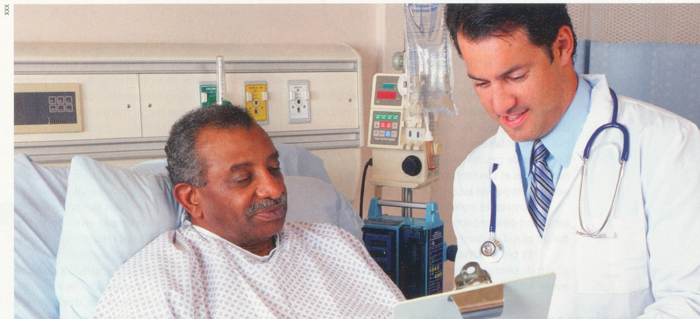
Le cancer colorectal touche 4000 nouveaux cas chaque année en Suisse.