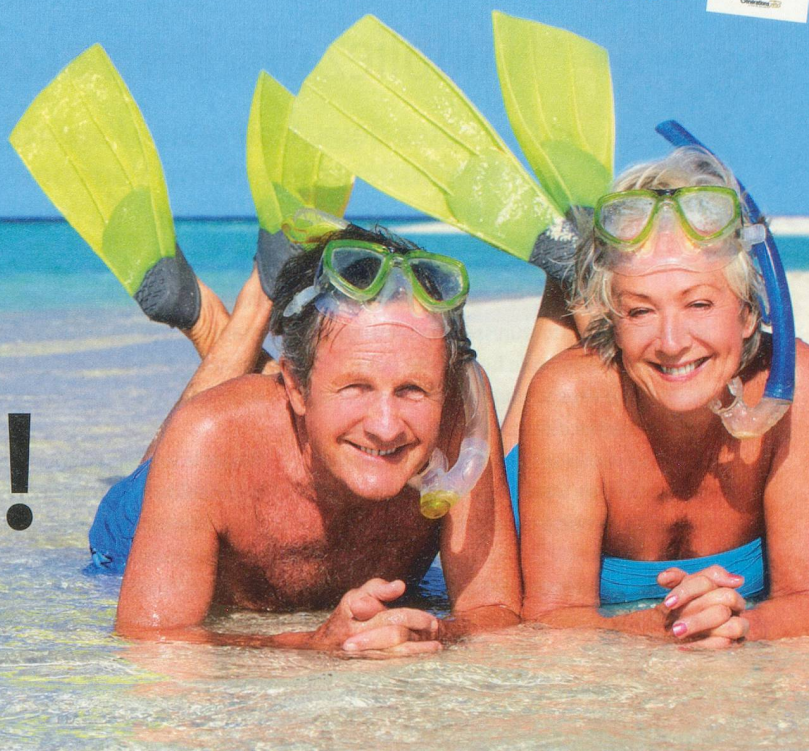
Monkey Business Images

En préparant votre escapade vers des destinations plus ou moins lointaines, vous éviterez ennuis de santé, tracasseries administratives inutiles et autres contrariétés pratiques. Nos six pages de guide à conserver.