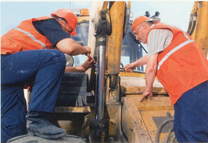
La loi devra prévoir des exceptions pour les métiers les plus pénibles.

facteurs démontrent effectivement que les seniors sont désavantagés, confirme Ewald Ackermann, porte-parole de l'Union syndicale suisse (USS). Les chiffres montrent que, les 60-65 ans – et même les 55 ans et plus – sont plus nombreux à se retrouver en fin de droits et qu'ils sont toujours sans emploi, cinq ans plus tard.» L'USS, qui prône une hausse des cotisations AVS plutôt que le report de l'âge de la retraite, combattra cette révision.