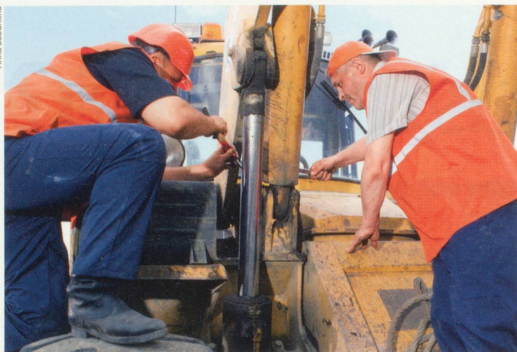
La loi devra prévoir des exceptions pour les métiers les plus pénibles.

facteurs démontrent effectivement que les seniors sont désavantagés, confirme Ewald Ackermann, porte-parole de l'Union syndicale suisse (USS). Les chiffres montrent que, les 60-65 ans – et même les 55 ans et plus – sont plus nombreux à se retrouver en fin de droits et qu'ils sont toujours sans emploi, cinq ans plus tard.» L'USS, qui prône une hausse des cotisations AVS plutôt que le report de l'âge de la retraite, combattra cette révision.