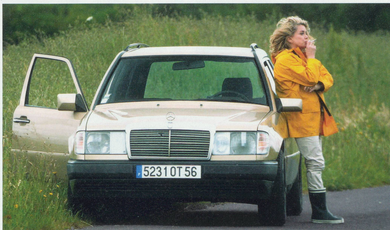
Le personnage de Catherine Deneuve part un jour acheter des cigarettes. Et ne revient pas... Gros coup de blues d'une sexagénaire.

Quand Catherine Deneuve se métamorphose en femme d'âge mûr happée par une pulsion de fuite, cela donne le film Elle s'en va . Les spectateurs réagissent.