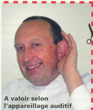
A valoir selon l'appareillage auditif