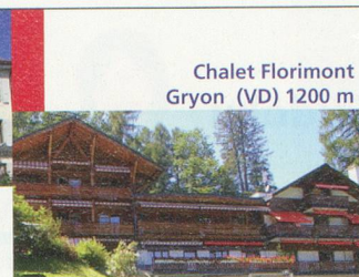
Chalet Florimont Gryon (VD) 1200 m