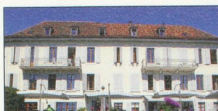
Nouvelle Roseraie St-Légier (VD) 480 m

Av. de la Gare 6 1003 LAUSANNE Tél.: +41 21 321 47 37