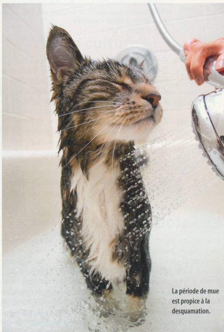
La période de mue est propice à la desquamation.

il est recommandé de vous adresser à un vétérinaire, afin qu'il vous conseille des croquettes adaptées. A ce propos, rappelons qu'on ne fait pas maigrir un chat en le rationnant, mais en modifiant son alimentation. Si nécessaire, le vétérinaire prescrira un supplément en oméga-3. L'absorption de ces acides gras permet, en effet, de résoudre ce problème dans un délai de trois à huit semaines. Et, pour conclure, n'oubliez pas de traiter régulièrement votre animal contre les parasites!