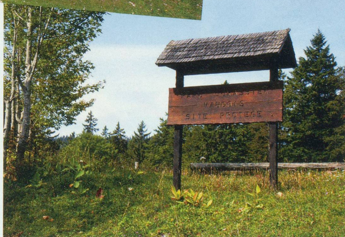
Entrée dans la réserve protégée du Parc Jurassien Vaudois.