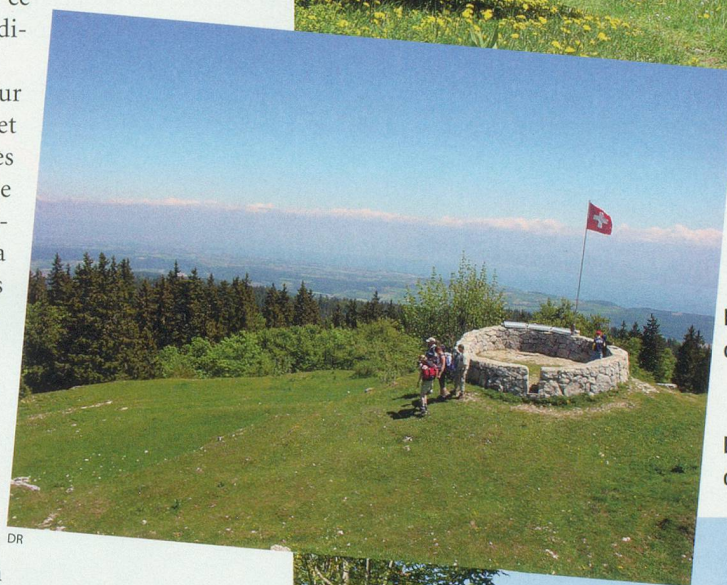
Panorama au sommet de la Neuve.