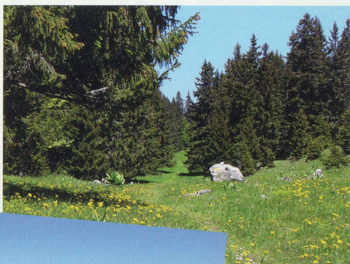
Dans le pâturage, peu après le chalet de la Neuve.

Au détour d'un virage, nous quittons la route pour prendre, sur la gauche, le sentier balisé qui s'élève rapidement dans les bois. Au passage d'un mur de pierre sèche, nous nous trouvons directement sous le crêt de la Neuve. Plutôt que de s'engager sur la pente raide qui y conduit, nous suivons les marques jaunes qui rejoignent la petite route goudronnée que nous venions d'abandon-