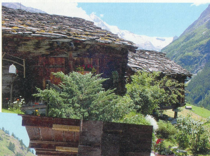
Quelques mayens dans la montée vers La Forclaz.

Il faut compter une heure de marche environ pour atteindre La Forclaz, le plus étendu des villages du lieu-dit «Sur-les-Rocs» qui compte également ceux de La Sage et Villa. C'est le plus grand des trois qui n'a été desservi par une route carrossable qu'à partir du milieu du XX e siècle. Imaginez, en le traversant, la vie avant 1954 alors que tous les transports s'effec-