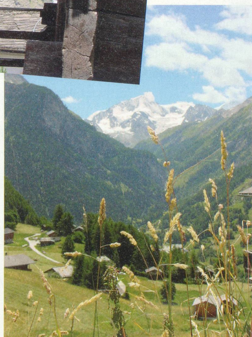
Vue sur le Pigne d'Arolla depuis la chapelle Saint-Christophe à La Sage.