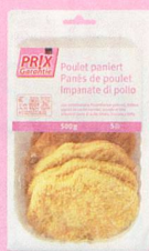
Panés de poulet Prix Garantie en libre-service, 500 g (100 g = 1.35) 6.75