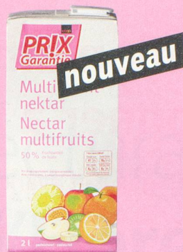
Nectar multifruits Prix Garantie, 2 litres (1 litre = -.87) 1.75