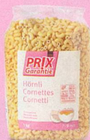
Cornettes Prix Garantie, 1 kg (100 g = -.17) 1.70