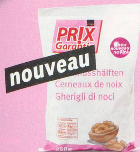
Cerneaux de noix Prix Garantie, 250 g (100 g = 1.68) 4.20

Déjà plus de 400 produits «prix bas garanti»!