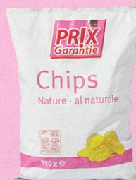
Chips nature Prix Garantie, 350 g (100 g = 1.05) 3.70