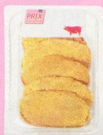
Escalopes de porc panées Prix Garantie, Suisse, en libre-service, env. 600 g 1.85 les 100 g