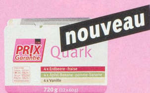
Préparation à base de séré fraise/pomme-banane/vanille Prix Garantie, 12 x 60 g (100 g = -.39) 2.75