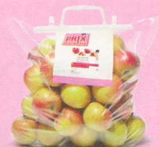
Pommes Prix Garantie, Suisse, le cabas de 2.5 kg (1 kg = 1.40) 3.50