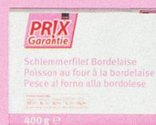
Poisson au four à la bordelaise Prix Garantie, 400 g (100 g = -.70) 2.80