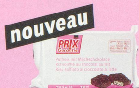
Galettes de riz enrobées de chocolat au lait Prix Garantie, 250 g (100 g = -.98) 1.95