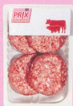
Galettes de viande hachée Prix Garantie, Suisse, en libre-service, 4 x 150 g (100 g = 1.37) 8.20