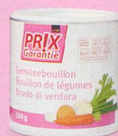
Bouillon de légumes Prix Garantie, 500 g (100 g = -.79) 3.95