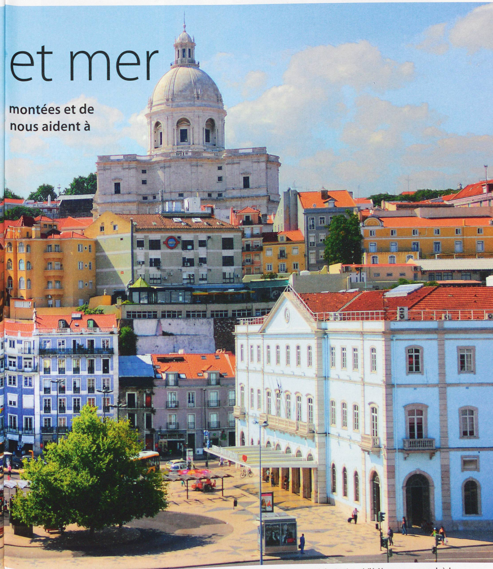
Capitale du Portugal, Lisbonne est aussi la plus grande ville du pays, avec plus d'un demi-million d'habitants et une population légèrement supérieure à 2 millions dans sa zone