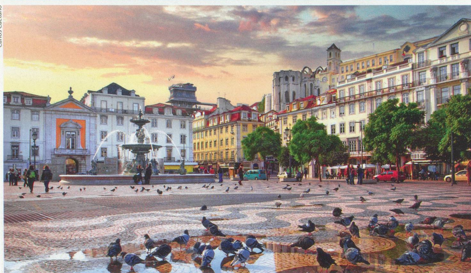
En haut: construite entre 1515 et 1521 sur les ordres de Manuel I er pour défendre le port du même nom, la Tour de Belém se dresse à l'embouchure du Tage. En bas: agrémentée d'une imposante fontaine, la place Dom Pedro IV est l'un des lieux de rassemblement les plus anciens de Lisbonne.

Notamment en montant à bord du tram N° 28, que l'on pourrait presque nommer désir. A l'issue de son trajet, qui le conduit au cœur des quartiers lisboètes les plus charmants de la capitale, on a en effet envie de poursuivre les présentations.