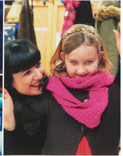
Enrichissante et intergénérationnelle au Théâtre de Vidy. A l'image des autres participants, c'est avec plaisir qu'ils se sont initiés au métier d'artiste et qu'ils ont accepté de