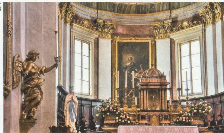
La cathédrale San Rufino est consacrée au saint du même nom, qui fut le premier évêque de la ville. C'est aussi un lieu rempli d'histoire, puisque c'est ici que sainte Claire et saint François ont été baptisés.