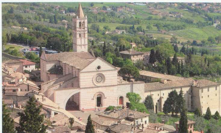
Comme son nom l'indique, la basilique Sainte-Claire recèle les restes de Claire, la première disciple de saint François, et contient plusieurs œuvres du XIII e siècle d'une grande beauté.

Bien d'autres endroits restent à découvrir: l'abbaye bénédictine de San Pietro, l'église de la Renaissance Santa Maria degli Angeli et les Carceri, une série de grottes située dans une vallée du mont Subasio qui servait de lieu de méditation et de retraite à François et à ses compagnons. Enfin,