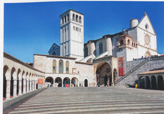
La basilique Saint-François à Assise qui comprend deux églises, est inscrite au Patrimoine mondial de l'UNESCO depuis 2000.

En partant de la basilique et en remontant la via San Francisco, artère principale de la ville, on découvre la basilique Sainte-