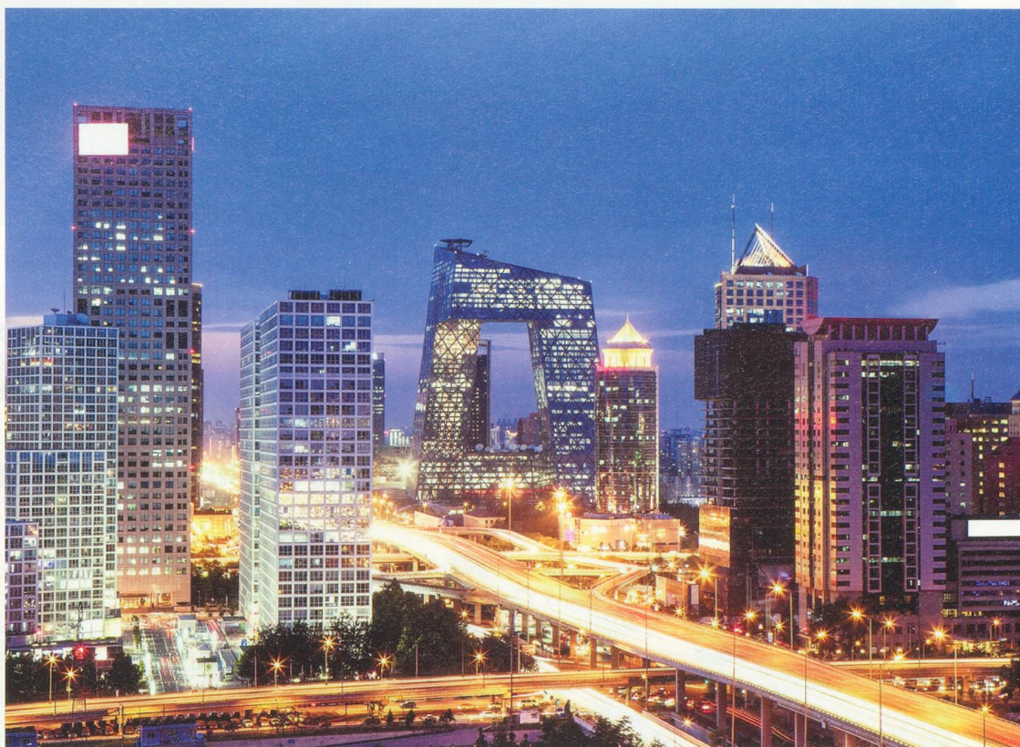
Le siège de la télévision centrale chinoise China Central Television (au centre), est un ensemble d'immeubles situé dans le nouveau quartier d'affaires de l'est de Pékin. Son bâtiment principal, le plus spectaculaire, atteint 234 mètres.