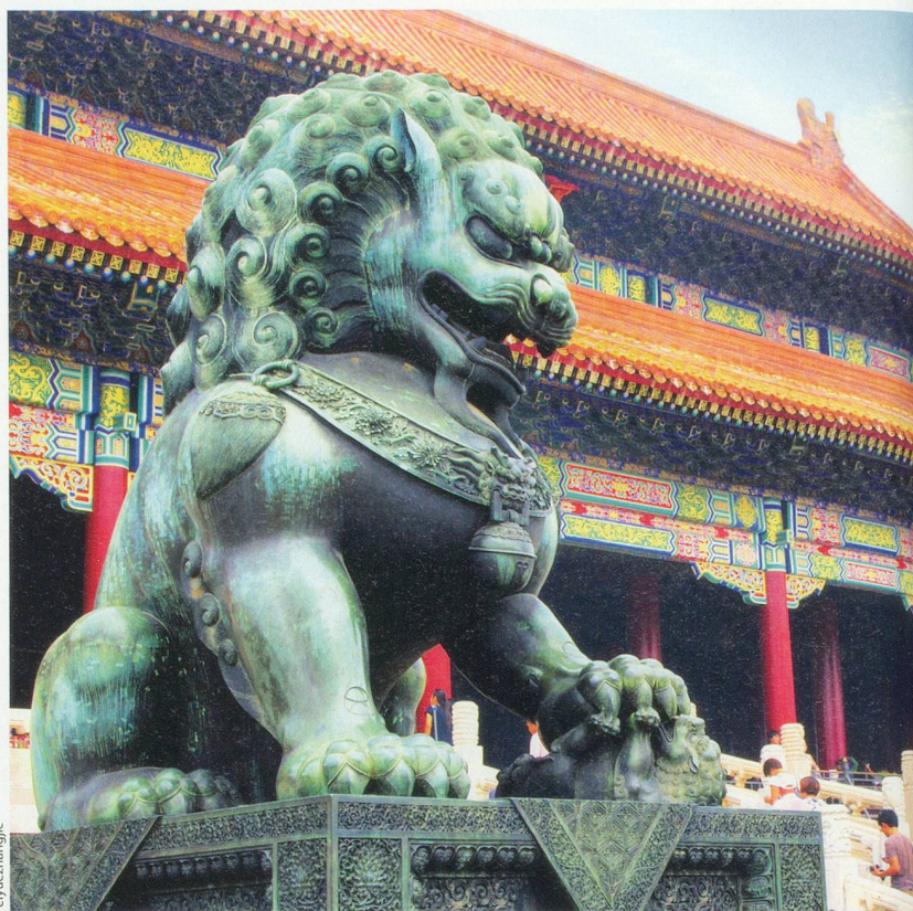
Au sein de la Cité interdite, on dénombre 6 paires de lions en bronze. Le lion symbolise la puissance et la patte repose sur une boule ou caresse un lionceau considéré comme le symbole de la succession impériale.

«On adore la Chine ou on la déteste», affirmait l'écrivain Lin Yutang (1895-1976). «Une fois en Chine, on est comme submergé par un chaos jouant son propre drame.» Autrement dit, il n'existe pas de juste milieu dans l'Empire du Milieu. Mais est-ce une raison pour boudier son plaisir? A défaut de pouvoir embrasser d'un coup ce «géant qui sommeille», il convient peut-être plus modestement d'apprécier les richesses, de se laisser aller à rêver en contemplant la Cité interdite, ancienne résidence des empereurs qui compte 8704 pièces, et non pas 9999 comme le veut la légende. Ou tout simplement en se baladant dans les parcs de Pékin, où des milliers de Chinois se livrent quotidiennement à une drôle de gymnastique, plus connue sous le nom de tai chi ( lire ci-dessous ).