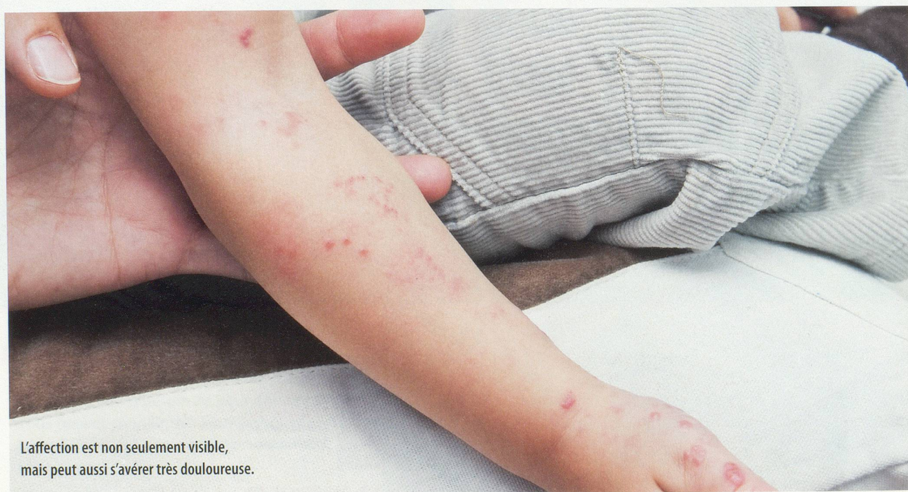
L'affection est non seulement visible, mais peut aussi s'avérer très douloureuse.

Avant les 72 premières heures, le médecin peut prescrire des comprimés antiviraux, comme le Valtrex®. De récentes études ont démontré que ces médicaments avaient une action bénéfique sur la réduction de la douleur.