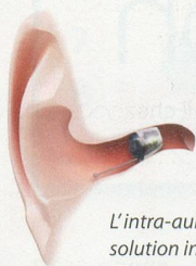
L'intra-auriculaire, solution infiniment discrète et efficace

Nos consultations auditives professionnelles commencent toujours par un test auditif gratuit et un entretien sans engagement. Vous apprenez alors où en sont vos facultés auditives.