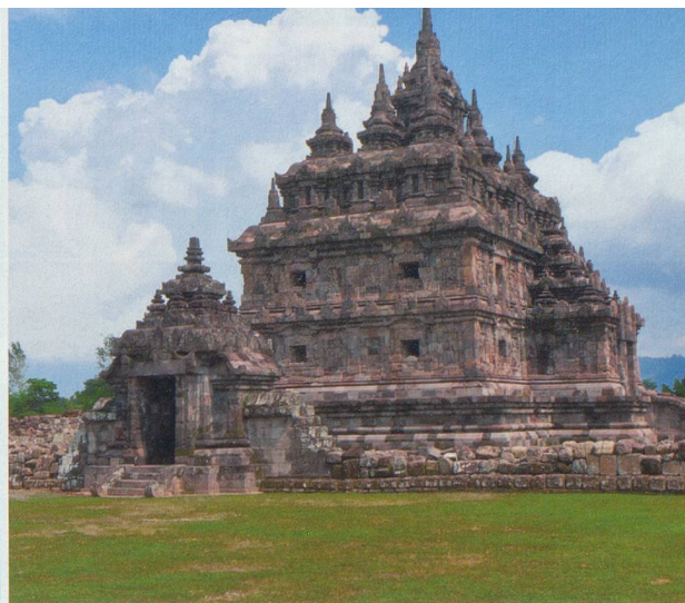
Situés à Bugisan, Candi Plaosan est un temple bouddhiste proche de celui de Prambanan.