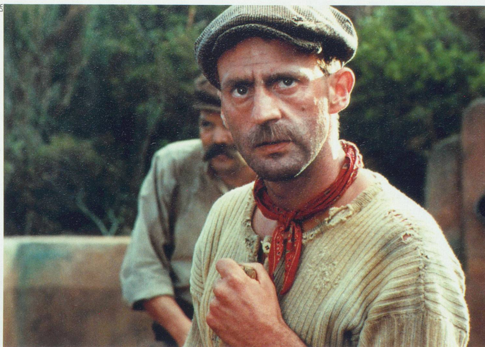
Applaudi par le public et respecté par la critique, Daniel Auteuil (63 ans) est l'un des monstres sacrés du cinéma français. Seule ombre au tableau: il coûterait plus qu'il ne rapporterait aux producteurs.

«O n ne peut pas être et avoir été», disait un jour un ami. Cruelle vérité qui saute une fois de plus aux yeux en lisant le palmarès 2012 des succès et des flops du cinéma français. Dans cette catégorie des très gros échecs, financiers du moins, c'est un film avec Isabelle Adjani qui obtient le plus mauvais classement. La star de L'été meurtrier n'est plus bankable comme on dit. Plus étonnant, les deux films suivants avaient pour tête d'affiche Daniel Auteuil! L'inoubliable interprète d'Hugolin dans Jean de Florette et Manon des sources a beau être considéré comme l'un des meilleurs acteurs de l'Hexagone par ses pairs, il ne rapporte plus un kopeck. Pire, il coûte de l'argent aux producteurs et ça ne pardonne pas. A l'avenir, les financiers miseront encore sur Valérie Lemercier ( Adieu Berthe a eu un rendement de 162%), Patrick Bruel ( Le prénom a rapporté près de 6 millions d'euros), même si à sa place on se méfierait vu son âge «avancé» (54 ans). Tout comme Jean Dujardin, d'ailleurs. Recevoir un oscar, c'est une chose, mais Les infidèles ont tout juste atteint l'équilibre financier, malgré un énorme battage médiatique.