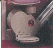
Lifts à siège